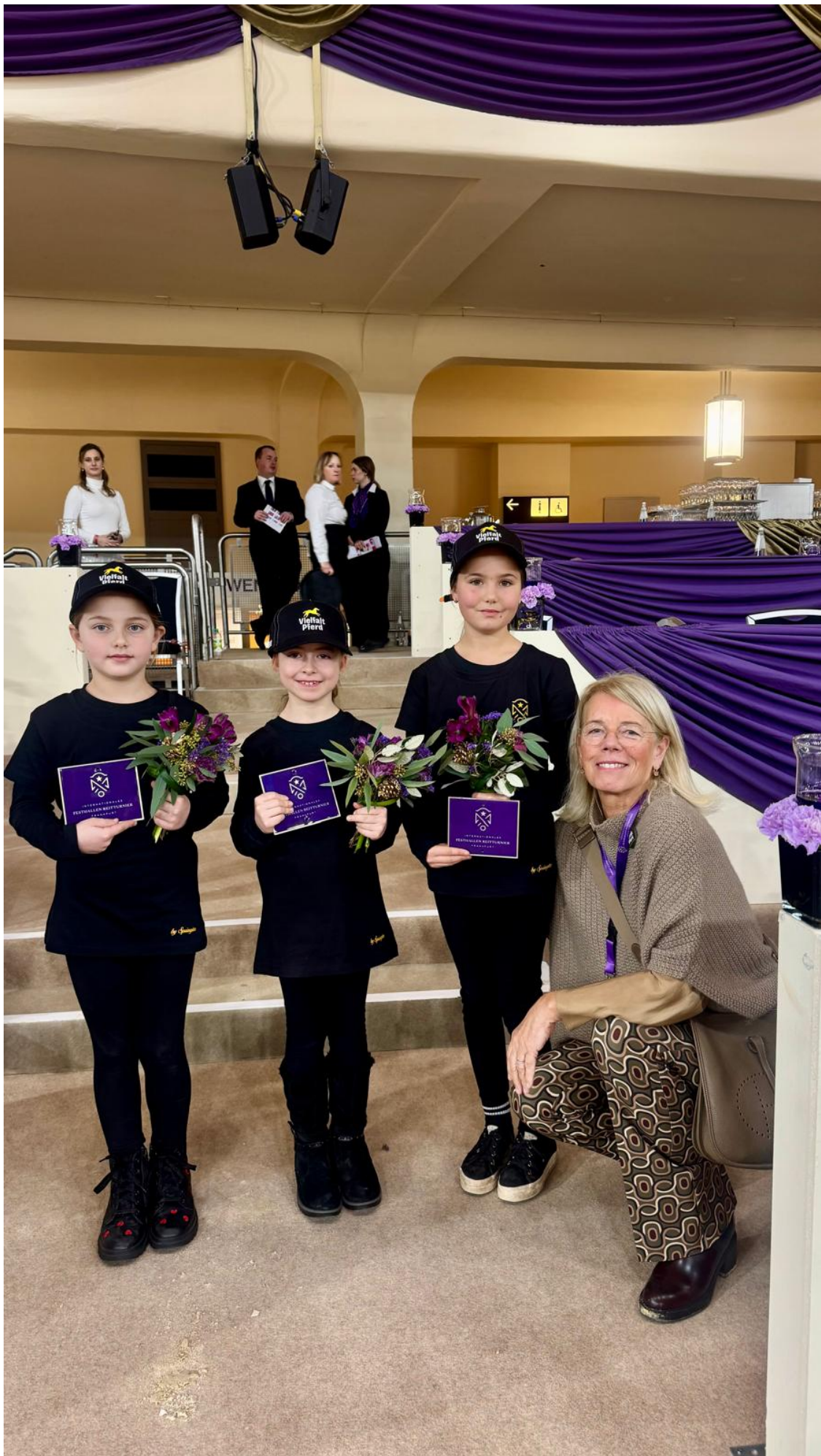
Wir haben zwei große Ziele!